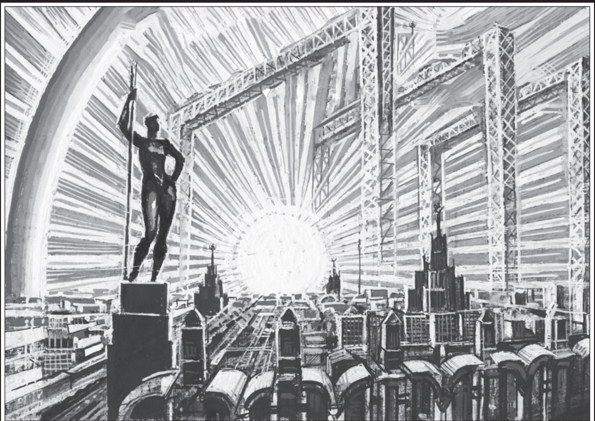
Рис. Геннадия ЖИВОТОВА

Над мёртвым роботом рыдают плачем, посылают бездыханное тело хлебными зёрнами, льют на него живую и мёртвую воду, провозносят заговоры, накрывают белыми холстами, где красным шёлком вышиты волшебные звери и птицы, спасительница русских — берегиня. Они поют над ним величальные, свадебные, застольные песни,