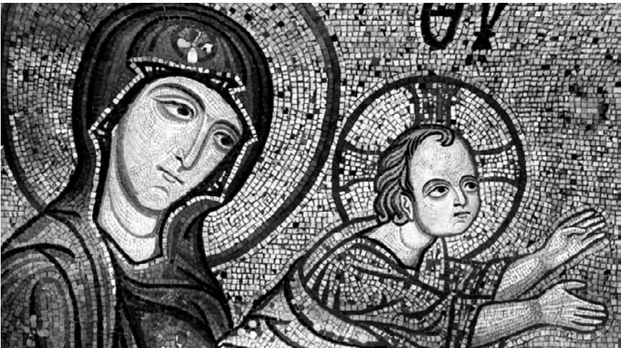
Фрагмент мозаики «Сретение» в Палатинской капелле в Палермо, Сицилия. XII в.

Заложённые в каждой иконе на сюжет из Нового Завета смыслы поистине неисчерпаемы. Не исключение в этом ряду и иконы праздника Сретения, высоко почитаемого в странах православного мира, вместе с верой принявших также и византийскую культуру и искусство. Фресковые и мозаичные композиции "Сретение" размещены на стенах христианских храмов в самых священных местах — поблизости от алтарной апсиды и даже на самой алтарной стене. Созерцать написанную на доске праздничную икону на аналое или в составе праздничного чина высокого иконостаса, конечно, хорошо. Но видеть её на стене храма, где она занимает предназначенное ей место в ряду икон других евангельских событий или в литургической программе росписей алтарной стены и апсиды, — совсем другое дело. Иконы святых в нижнем