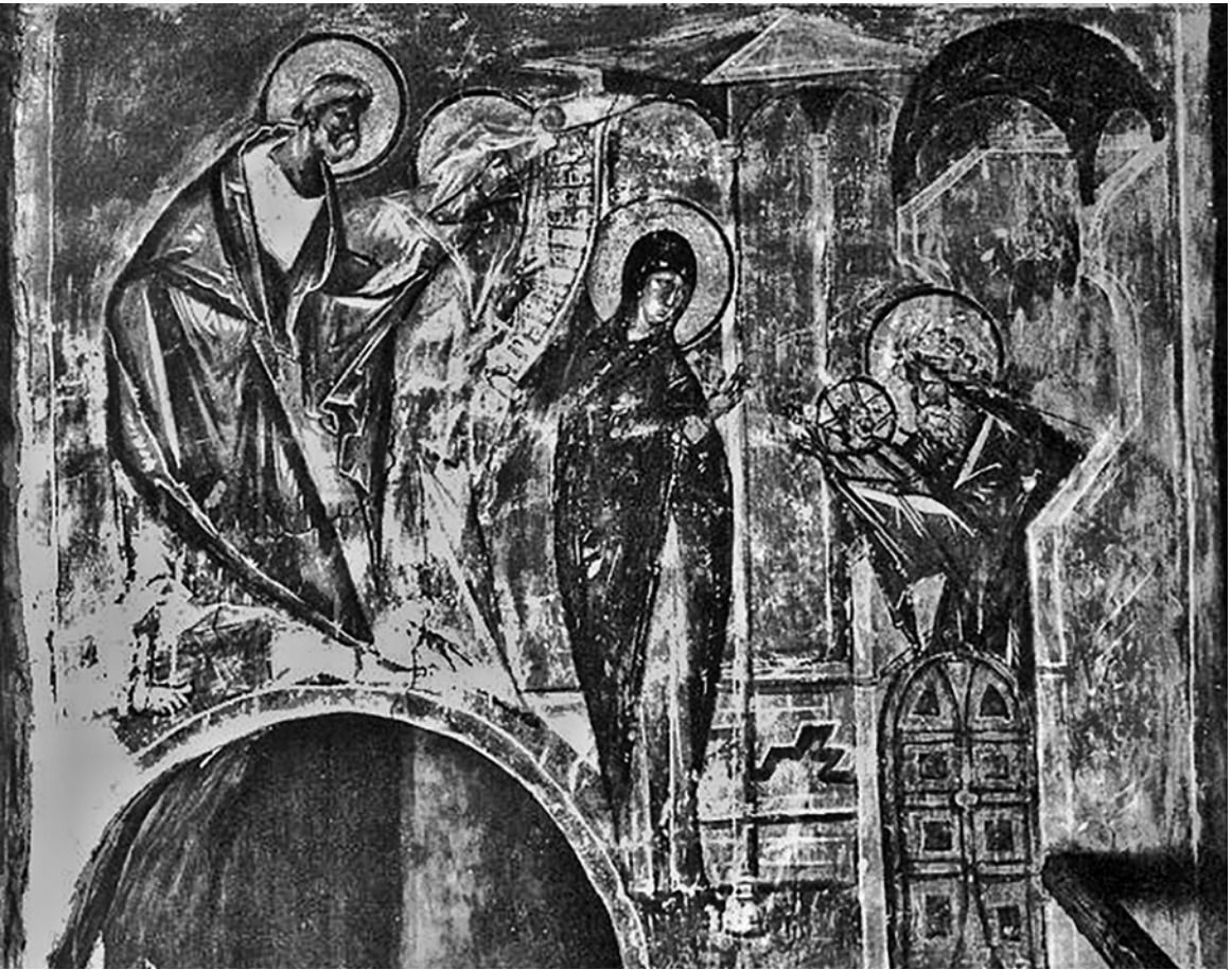
Роспись храма Успения на Волоотовом поле в Новгороде. Вторая половина XIV в.