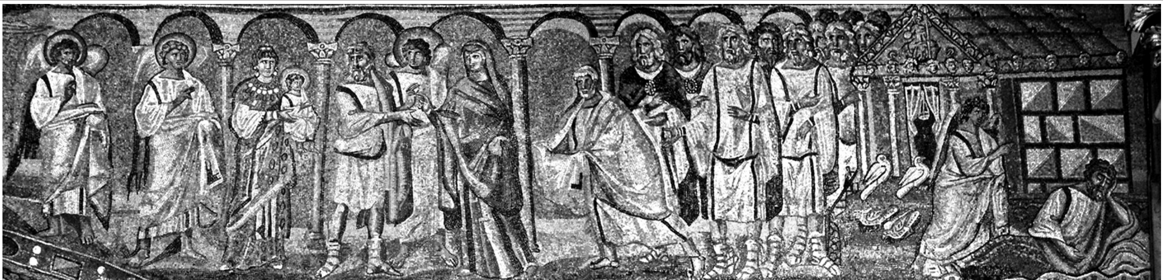
Мозаика в римской базилике Санта Мария Маджоре. 432–440 гг.