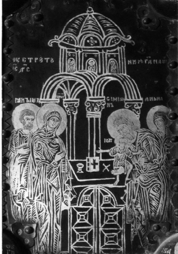
Деталь Васильевских врат Собора Святой Софии в Новгороде. 1336 г.

Праздник Сретения Господня — один из самых древних в христианской Церкви. До наших дней дошли проповеди на этот праздник знаменитых отцов Церкви Афанасия Александрийского, Мефодия Патарского, Кирилла Иерусалимского, Григория Богослова, Григория Нисского и Иоанна Златоуста, произнесённые ими и записанные уже в IV–V веках. А в VI веке Второй Рим — Империя Ромеев при императоре Юстиниане сделала праздник Сретения Господня общегосударственным, после чего традиция торжественного празднования его распространилась по всему христианскому миру. Из Евангелия от Луки (2:22–39) мы узнаём, что на сороковой день после Рождества земные родители Иисуса Христа — Богородица Мария с праведным Иосифом — приносят Его в Храм Иерусалимский, где происходит знаменательная встреча — Сретение по-церковнославянски — с двумя последними пророками Ветхого Завета — старцем Симеоном и пророчицей Анной. Именно эта встреча Нового Завета в Лице Богомладенца Иисуса и Его Пречистой Матери с Заветом Ветхим, уходящим в лице престарелых Симеона и Анны, и является темой праздника и, соответственно, его иконографии.