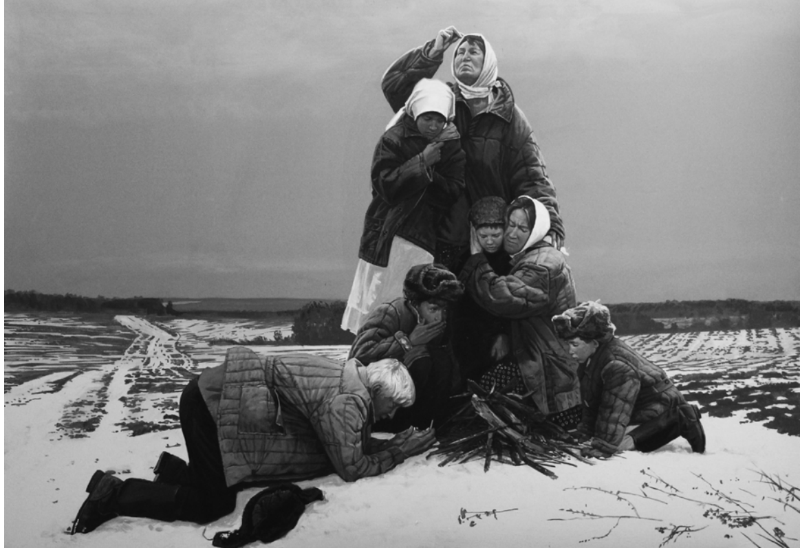
«Последняя спичка». 2024 г.

Выставка открыта до 10 мая в здании Российской академии художеств по адресу: Москва, ул. Пречистенка, д. 21