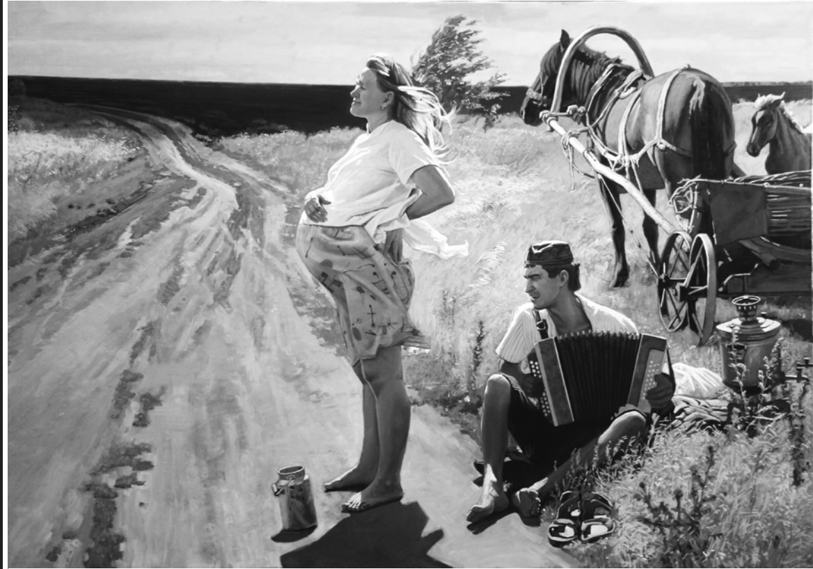
«Счастье». 2018 г.

лях небывалого сказочного леса. А дальше, за деревней, — степь. Широкая, раздольная..." — так описывает художник родные места. Уроженец села Кислянка Курганской области, он прошёл классическую школу: художественное училище в Самаре, а затем Суриковский институт. Но подлинной кузницей мастерства стала для него "Академическая дача имени И.Е. Репина", где его наставниками были легендарные мастера — братья Ткачёвы, Юрий Кугач, Валентин Сидоров. Именно от Кугача молодой живописец перенял убеждение, что сюжетная картина должна "внушать зрителю оптимизм и пробуждать вкус к жизни", и это отчётливо читается в представленных на выставке жанровых работах автора. Особый интерес представляет экспозиционное решение. Подшивалов, известный своим глубоким интересом к этнографии, традиционно дополняет живопись подлинными предметами крестьянского быта, которые лично собирал в экспедициях. Этот кураторский ход стирает грань между плоскостью холста и трёхмерным миром, превращая выставку в подобие инсталляции, где вещи обретают собственный голос. Нельзя обойти вниманием и тот факт, что живописец известен также как писатель, лауреат литературной премии "Русь моя" имени Сергея Есенина. Его "Деревенские рассказы" становятся вербальным продолжением сюжетов, начатых кистью.