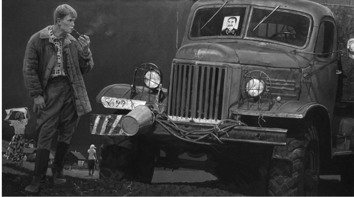
«Сталин». 2025 г.