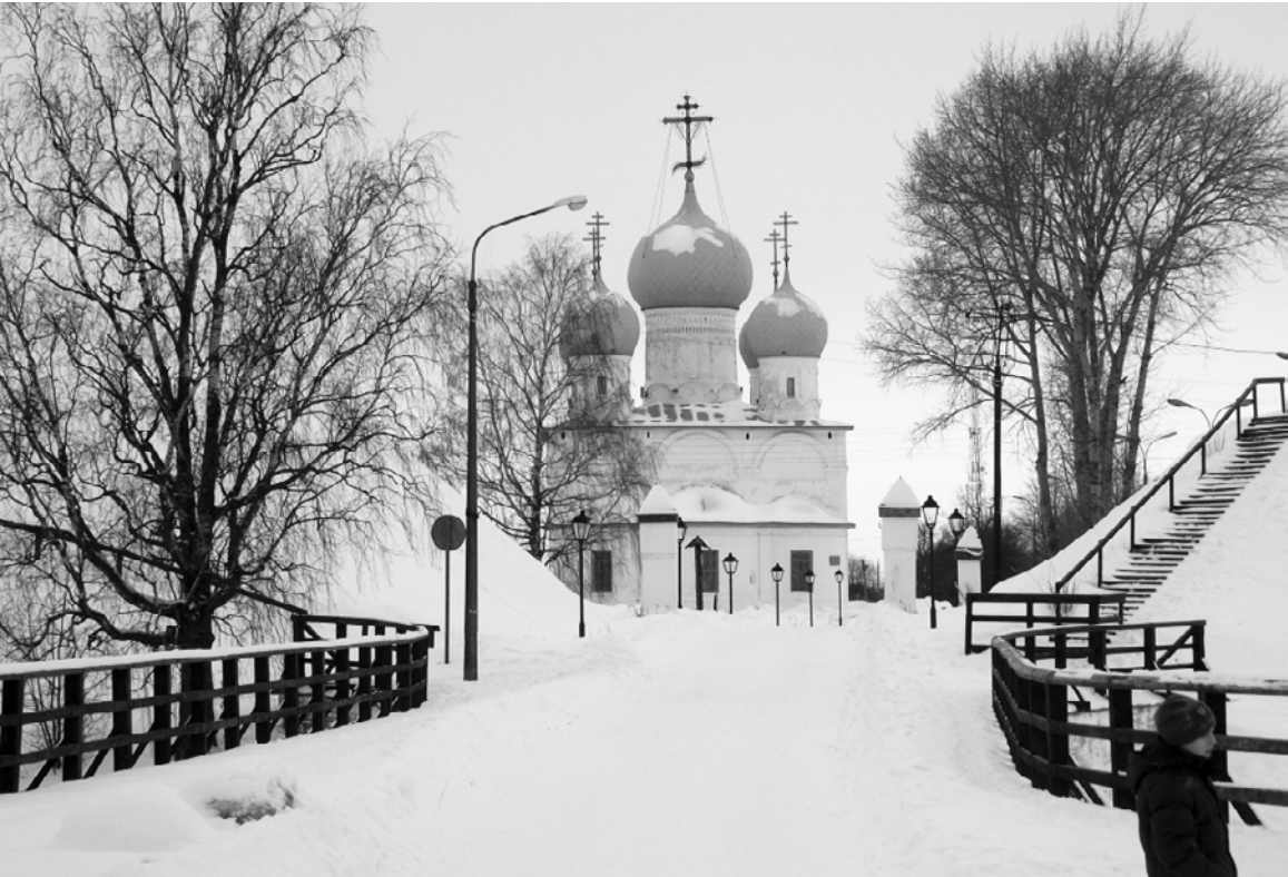
Спасо-Преображенский собор Белозерского кремля

куполах церквей и храмов, видневшихся из-за "вала" — земляной крепости — и по сторонам её, занималось зарёй, а озеро кудрявилось белыми барашками, на которых уже плясали рыбацкие паруса, а на обводном канале, встречные, басовито гудели белые пароходы..." Создание туристического маршрута Кириллов — Ферапонтово — Белозерск поможет лучше узнать историю становления государственности России и её духовную опору. Развитие туристической инфраструктуры Белозерска несомненно потребует тщательной проработки и значительного финансирования. В то же время в городе есть вопросы, которые область может решить самостоятельно. Уважение к гостям Вологодчины демонстрирует преобразованная вокзальная площадь Вологды, новые современные конструкции на въезде в Вологодскую область. Хотелось бы, чтобы и Белозерск показывал такие же внимание и заботу в отношении гостей. В городе имеется прекрасное здание автовокзала, которое в настоящее время находится в частных руках и используется не по назначению. В план 2025 года