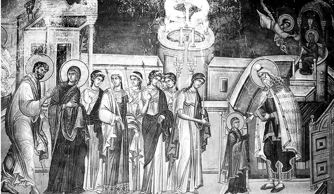
Фреска кисти художника Михаила Астралы в церкви Иоакима и Анны («Кралевој») в сербском монастыре Студеница (начало XIV века)

ся назад Дитя, и дух Её да не отделиться от Дома Божия". И девы сделали так и вошли в храм. И первосвященник принял Дитя, поцеловал Её и сказал: "Мария, Господь дал величие имени Твоему во все роды, и в конце дней Господь проявит в Тебе цену искупления сынов Израилевых". И он поставил Её на третью ступень жертвенника, и Господь Бог излил милость Свою на Нее, и Она дрожала от радости и плясала на ногах Своих, и полюбил Её весь