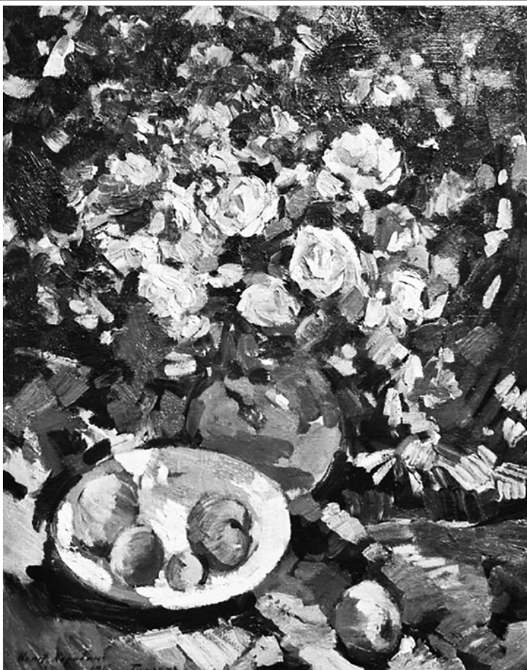
«Розы. Гурзуф. 1917». Художник Константин Коровин

Василий Поленов — ещё один преподаватель Константи-на Коровина. "Перед оконча-нием московского Училища живо-писи и ваяния мы, пейзажисты, узнали, что к нам вступит про-фессором в училище Поленов. На передвижной выставке был его пейзаж: жёлтый песочный бугор, отражённый в воде реки в солнечный день летом. Как-ие свежие, радостные краски и солнце! Густая живопись. Я и Левитан были поражены этой картиной. Я тоже видел синие тени, но боялся их брать, — все