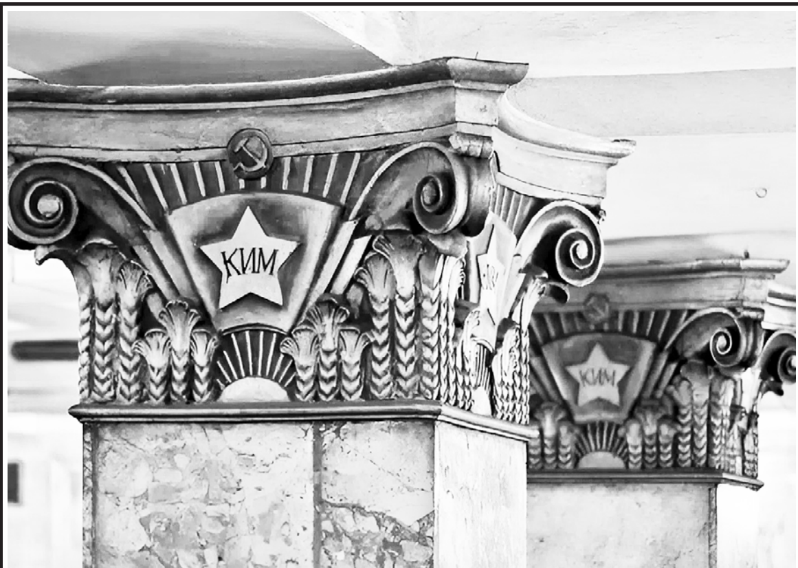
Яркий пример московского метросталинизма. Капители колонн на станции «Комсомольская-радиальная», 1935 г.