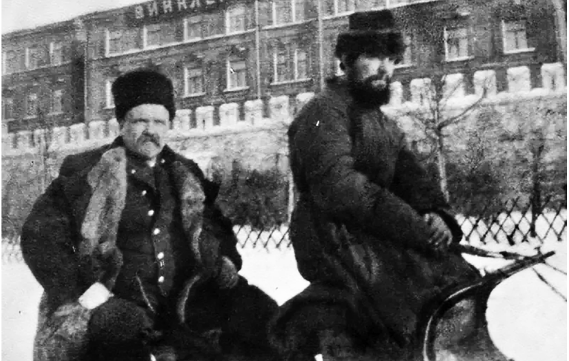
Владимир Алексеевич Гиляровский на Воскресенской площади. 1890-е гг.

Несколько работ посвящены Сухаревой башне — таинственной, странной, не то феерической, не то безобразной. Этот шедевр отечественного барок-