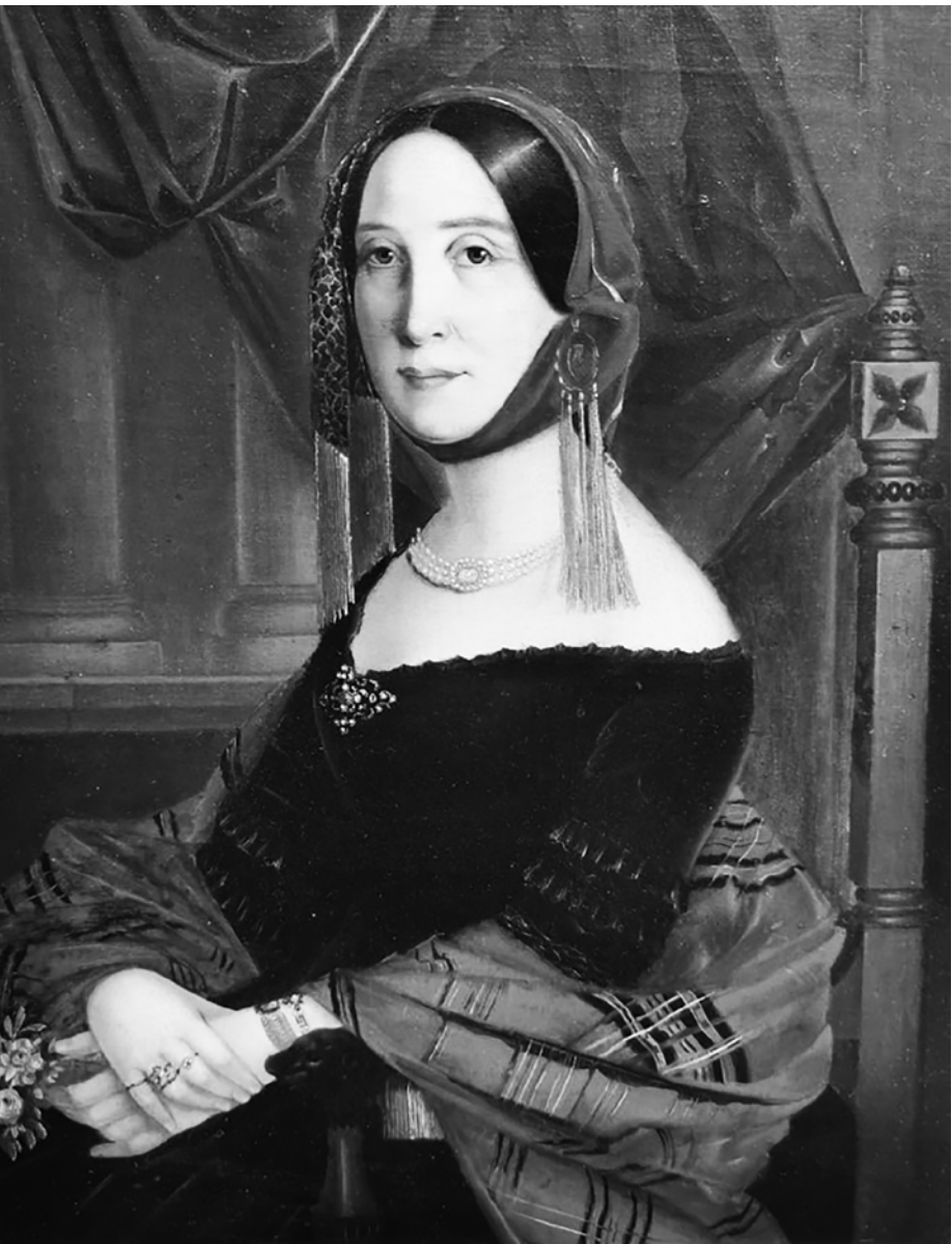
Портрет Татьяны Мусиной-Пушкиной. Неизвестный художник. 1840-е гг.

Вот и часы, которые воспринимались как вещь престижного потребления и стояли не в каждом доме. Они и оформлялись с невероятной помпой. Даже крохотный английский вариант фирмы Джона Тейлора — шедевр искусства. А уж как замечательно каминные часы "Аполлон и Талия" французского бренда "Ле Руа и сыновья" с фигурками древнегреческих небожителей — по-