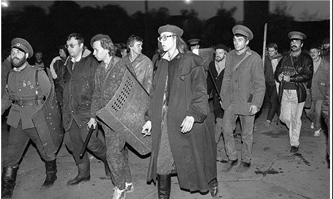
У телецентра «Останкино». 3 октября 1993 г.