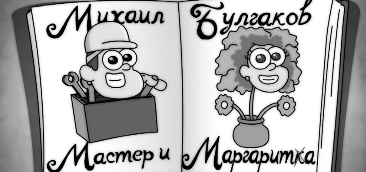
Кадры из веб-сериала «Мастер и Маргарита», проект для детей «Мультиратура»