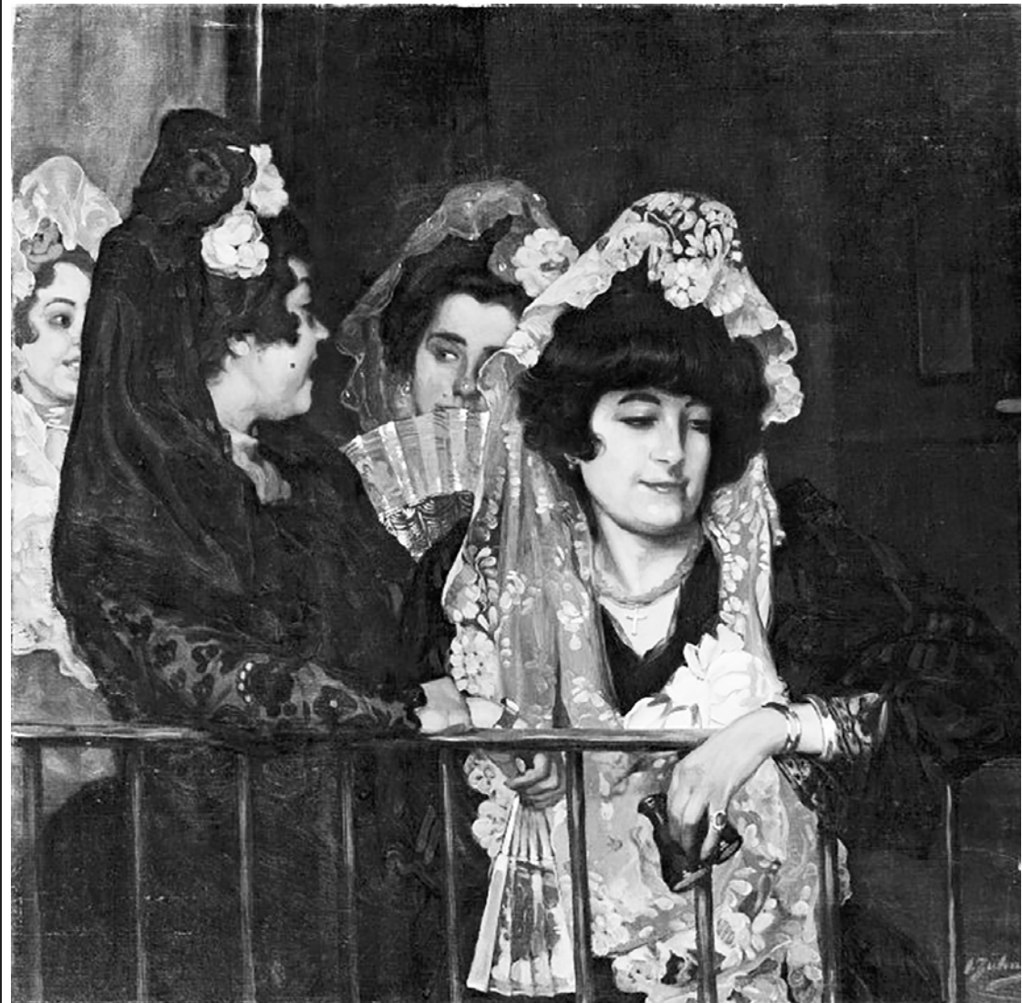
«Испанка в ложе на Пласа де Торес» (1901). Художник Игнасио Сулоага

кастаньет". Вторил и Михаил Кузмин: "Заплаканная, прекрасна и желанна, / Я думал, сквозь трепещущий туман, / Что встретится со мною донна Анна, / Которой уж не снится дон Жуан". Растворение в солнечном мареве. Тёмные кудри. Арагонская хота. От Севильи до Гренады в тихом сумраке ночей... Это вызывало острый восторг.