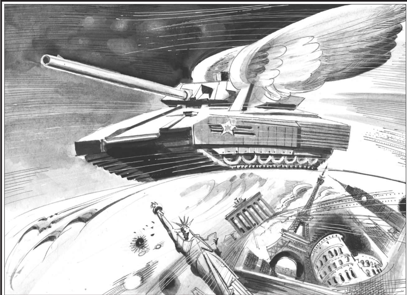
Рис. Геннадия ЖИВОТОВА

Существует насекомое, именуемое "оса-наездник". Это не та оса с чудным чёрно-золотым тельцем, которая садится на вазочку с вишнёвым вареньем, и мы вычерпываем её оттуда чайной ложечкой. Оса-наездник имеет тонкое длинное тельце, изящные хрупкие крылья, цепкие лапки. Она ищет ползущую в траве тучную гусеницу, которая неугомонно жуёт травяные листья, наращивая свою жирную плоть. Оса-наездник садится на гусеницу верхом, сворачивает крепельком своё гибкое тельце, выпускает из хвоста волосяное жало, именуемое "яйце-