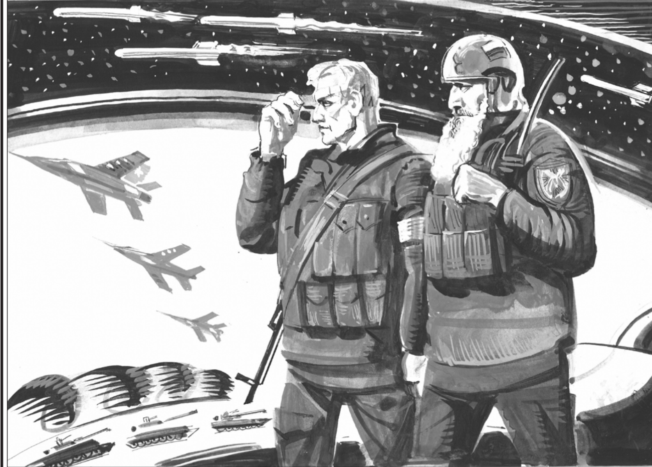
Рис. Геннадия ЖИВОТОВА

Запад — это не только потоки тяжёлых гаубиц и "Джавелинов", направляемых на Украину. Не только парламенты и премьеры, вводящие одну за одной бесконечные антирусские санкции. Не только телемагнаты, захватившие теле-