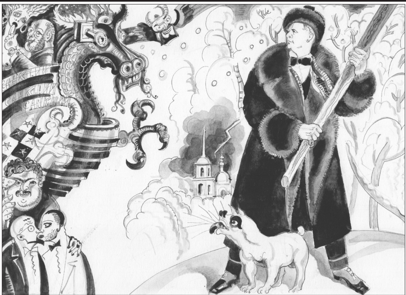
Рис. Геннадия ЖИВОТОВА

В гибридной войне противник, изучивший наши уязвимые места, наносит разящие удары в сокровенные русские коды, одним из которых является код Победы. Защищая этот код, Государственная Дума приняла закон о защите ветеранов, которых всё чаще подвергают оскорблениям, а вместе с ними оскорбляют великую Победу.