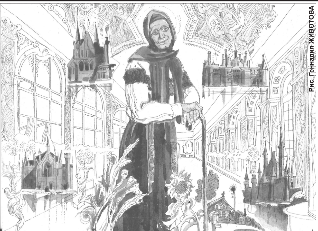
Рис. Геннадия ЖИВОВА

Заявленное когда-то развитие так и не состоялось, не было рывка ввысь, а только непрерывное скольжение вниз. Мы ждали, что Крымская весна охватит не только Донбасс, но и всю Новороссию, однако атака ополченцев была остановлена, и мы годами смотрим, как население Донбасса посыпается бомбами и танковыми снарядами, и текут гробы, текут слёзы. В этой тоске народ забыл о солнце Крыма.