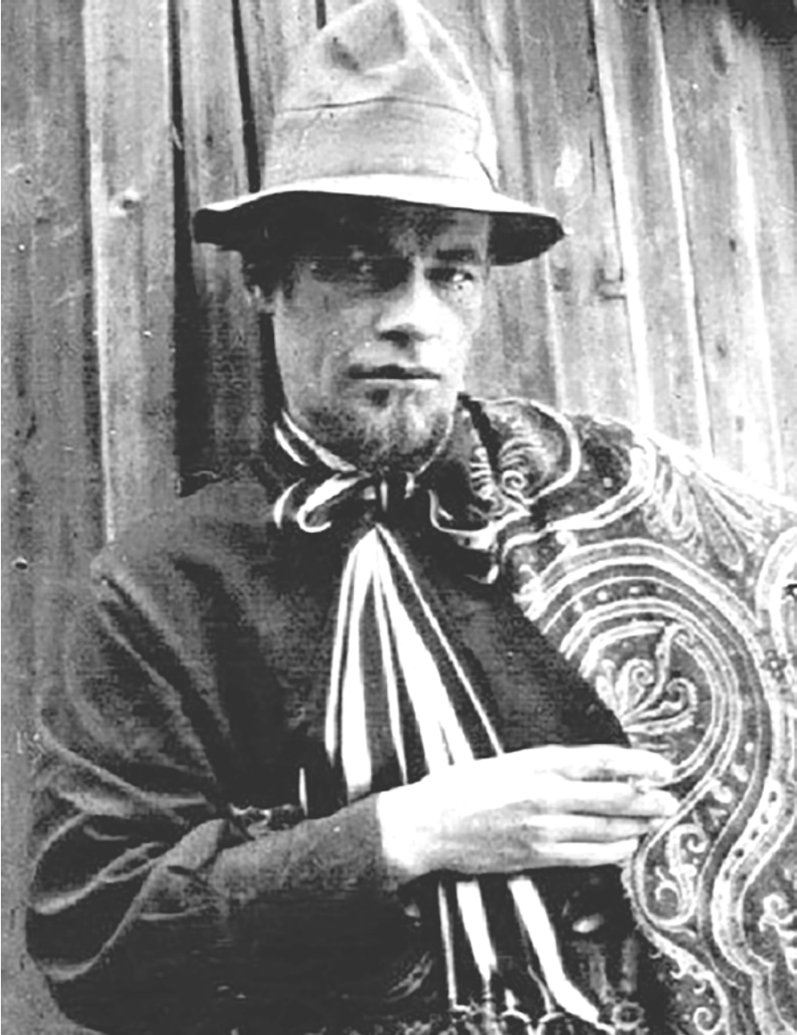
"Время — вещь необычайно длинная, — были времена — прошли былинные" Владимир Маяковский