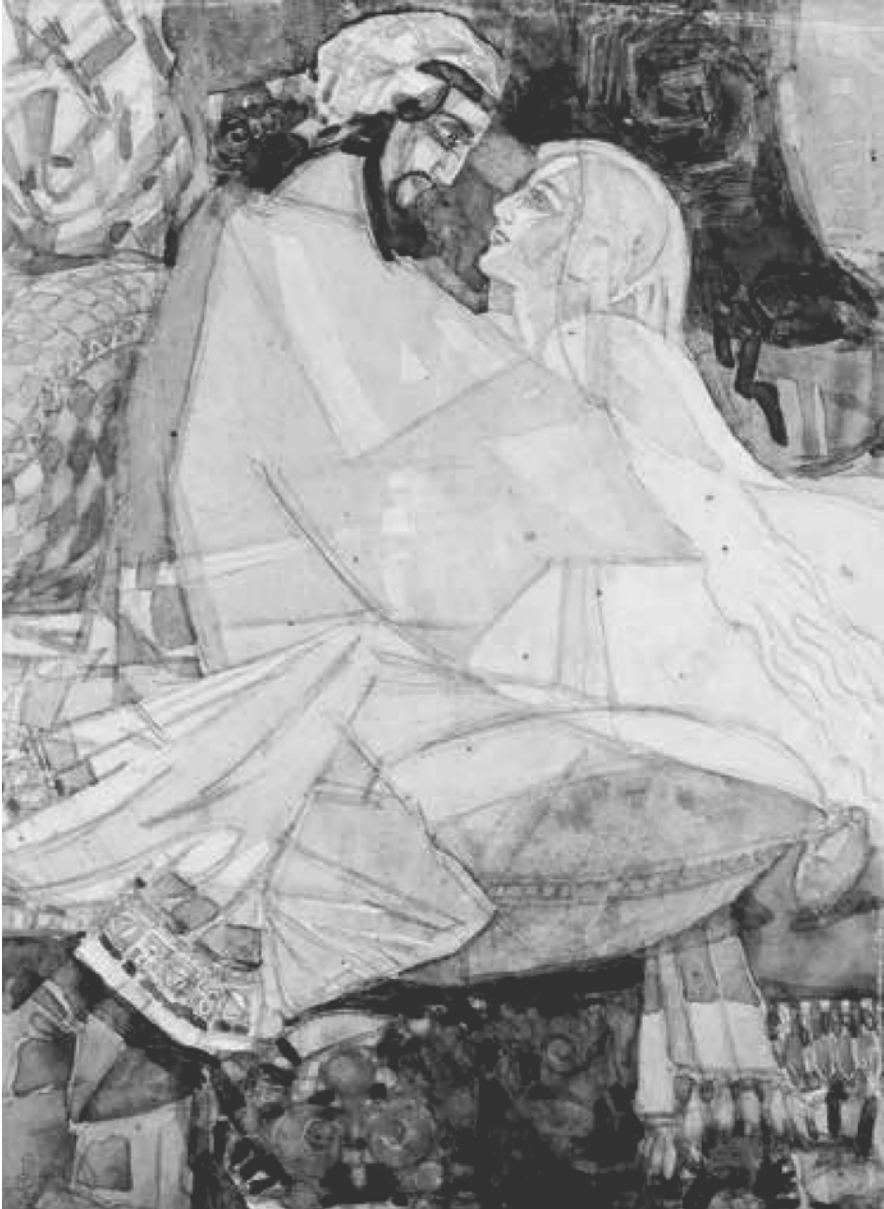
Иллюстрация к повести А.И. Куприна «Суламифь». 1921