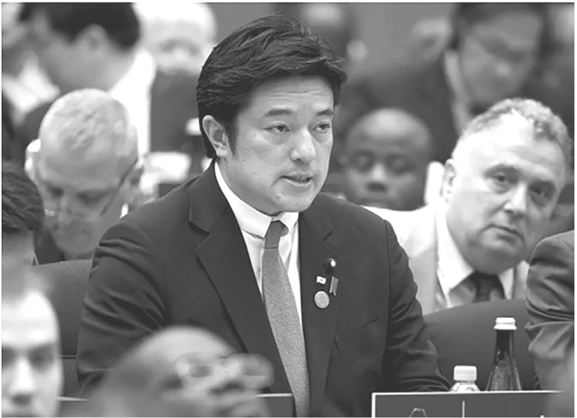
«В смутные времена по одному слову можно распознать силу или малодушие» (Кодекс Бусидо). На фото: агент влияния США, заместитель министра обороны Японии Ясухиде Накаяма

партнёров. Параллели со Второй мировой войной в устах замминистра обороны Японии действительно звучат несколько парадоксально и нетактично. С одной стороны, он напомнил о "большом месте" в истории японо-американских отношений, а с другой стороны, после американской ядерной бомбардировки Хиросимы и Нагасаки японцам испытывать перед США неловкость тоже как-то странно. При этом он беспокоится о тех, кто нанёс его родине самый большой ущерб за всю её историю, призывая относиться осмотрительно по отношению к тем, кто на самом деле особой угрозы не представляет и даже во время войны достаточно гуманно относился к японским военнопленным, не-