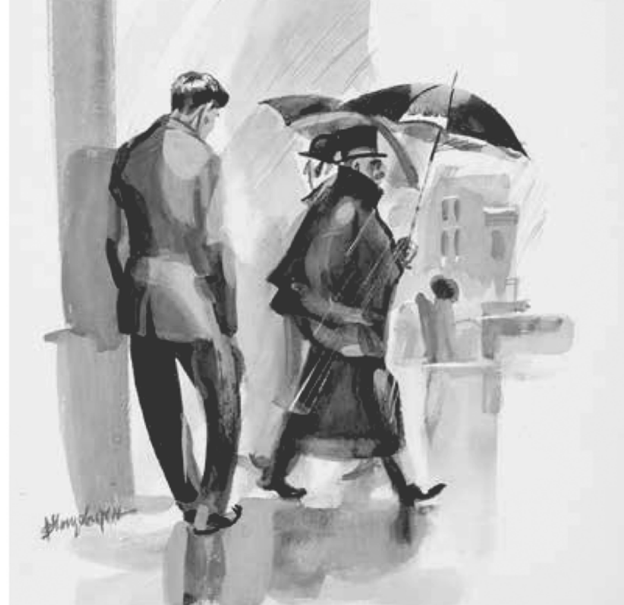
Иллюстрация к роману Б. Брехта «Роман нищих». 1935