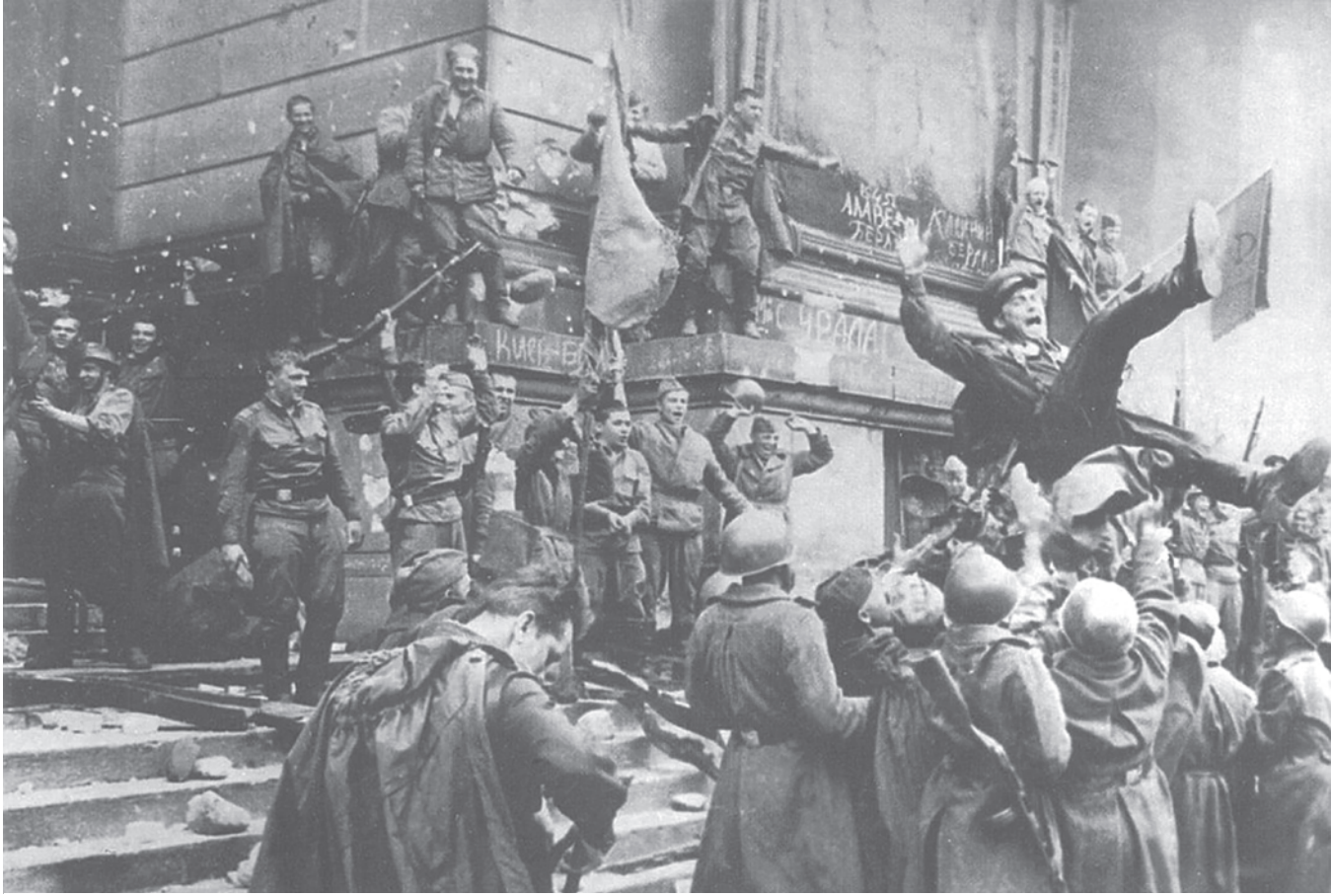
Май 1945 года. Воины 150-й стрелковой Идричко-Берлинской, ордена Кутузова 2-й степени дивизии у Рейхстага

В этой связи следует категорически приветствовать предложения Святейшего Патриарха Московского и Всея Руси Кирилла, сделанные им на встрече с Владимиром Путиным, о систематизации церковного окормления структур, борющихся против терроризма. Конечно, эти структуры, в первую очередь — Росгвардия, должны окормляться военными священниками. Домовый храм св. Софии уже несколько лет действует при центральном офисе ФСБ. Такие же храмы должны быть и для всех силовых структур Российской Федерации, в ключевых центрах и школах подготовки сил профилактики и борьбы против терроризма и его последствий, в их гарнизонах. Штатное военное духовенство, которое уже действует в армии и на флоте, должно появиться в Росгвардии, ФСБ, МВД, ГРУ ГШ, СВР, МЧС, при Контртеррористическом и Следственном Комитетах России.