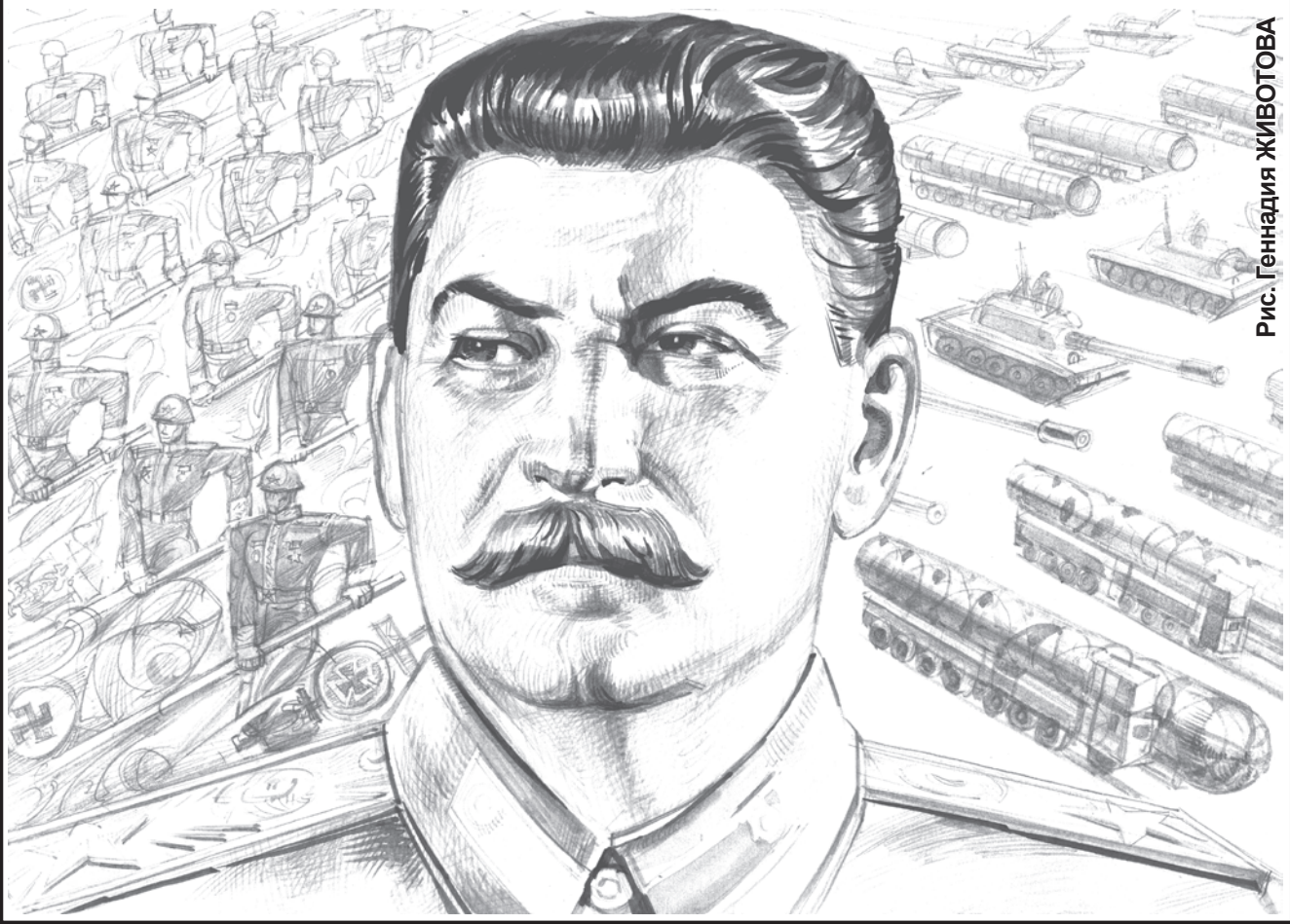
Рис. Геннадия ЖИВОВА

Лужков был причастен к зверскому расстрелу Дома Советов в 1993 году, когда в центре Москвы пылали парламент, лежали растерзанные тела баррикадников, а лужковские сторонники били велосипедными цепями выходивших из горящего здания депутатов. При Лужкове в Москве грохотали выстрелы, бандиты захватывали особняки, заводы, культурные