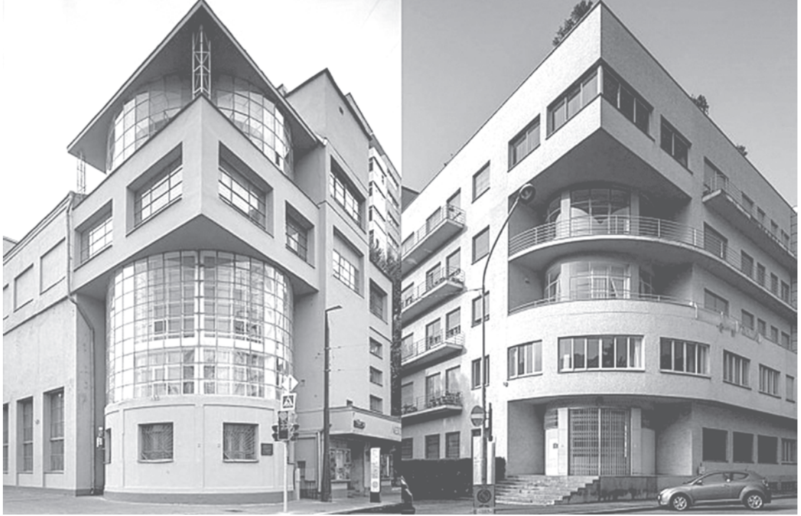
Новокомум в Комо (1927-1929, архитектор Джузеппе ТЕРРАНЬИ) и Клуб им. С. Зуева в Москве (1927-1929, архитектор Илья ГОЛОСОВ)

Новокомум в городе Комо — жилое здание и вот что занимательно: в Италии под все эти эксперименты никто бы не дал ни пяди римской или неаполитанской земли, поэтому в академических словарях указывается, что уникальный город Комо — центр авангардного строительства. В Со-