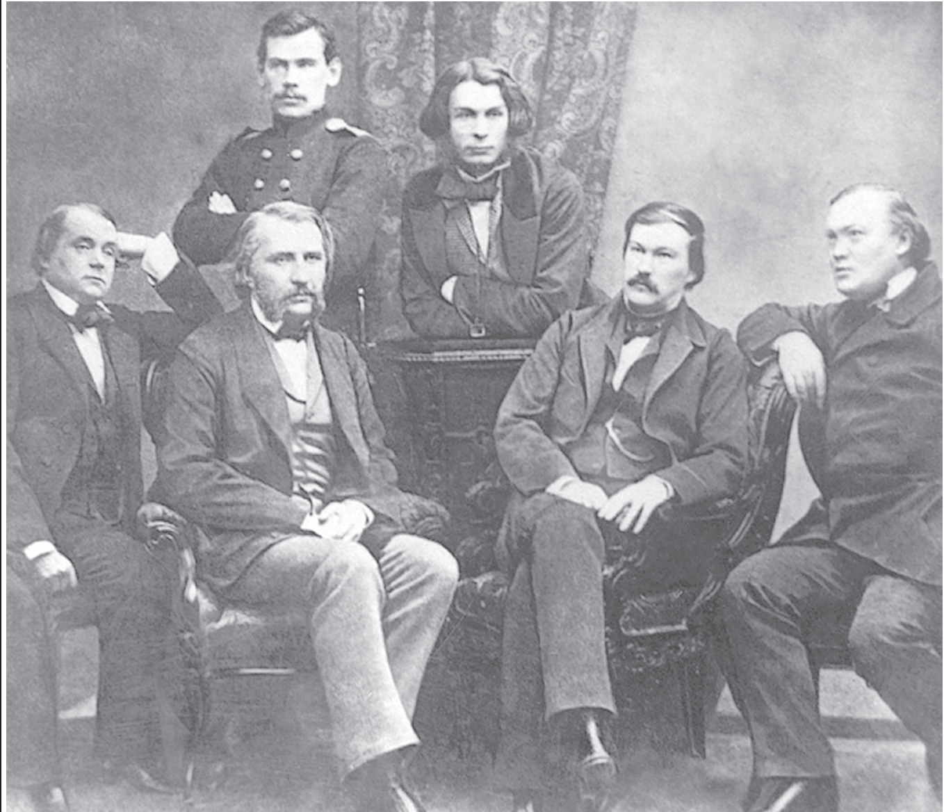
Группа сотрудников журнала «Наш современник». Сидят (слева направо): И.А. ГОНЧАРОВ, И.С. ТУРГЕНЕВ, А.В. ДРУЖИНИН, А.Н. ОСТРОВСКИЙ; стоят: Л.Н. ТОЛСТОЙ, Д.В. ГРИГОРОВИЧ. Фото 1856 г.