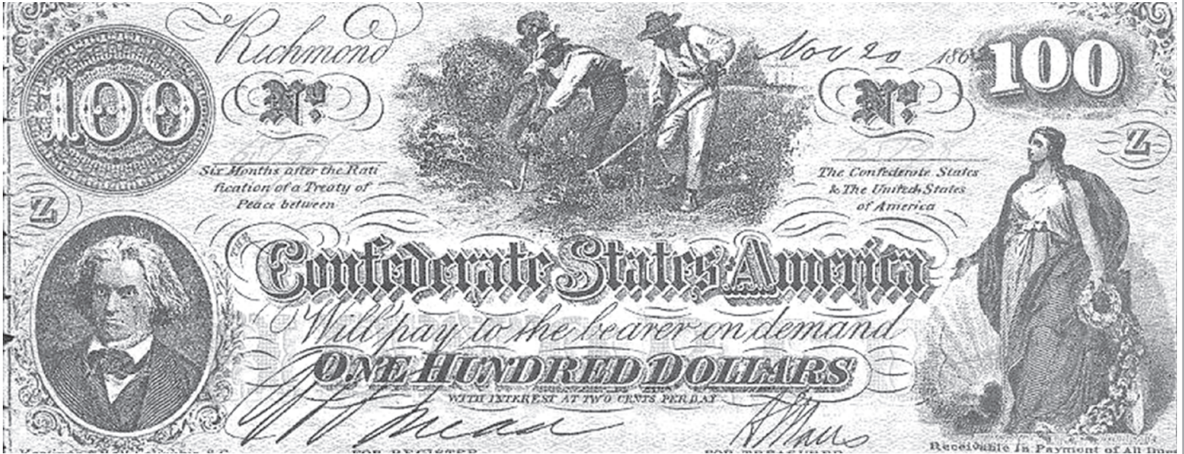
На столлларовой банкноте, выпущенной в 1862 году Южной Конфедерацией, изображён главный источник богатства этих штатов — труд негров-рабов на плантациях. Федрезерв США на своих долговых расписках скрывает источник богатства Америки — эксплуатацию всего мира

Поэтому сегодняшняя мировая экономика — это, по большей части, именно набор иллюзий, среди которых, например, нынешний сверхнизкий уровень безработицы во многих развитых странах. Но если вы посмотрите на Южную Европу или страны с формиру-