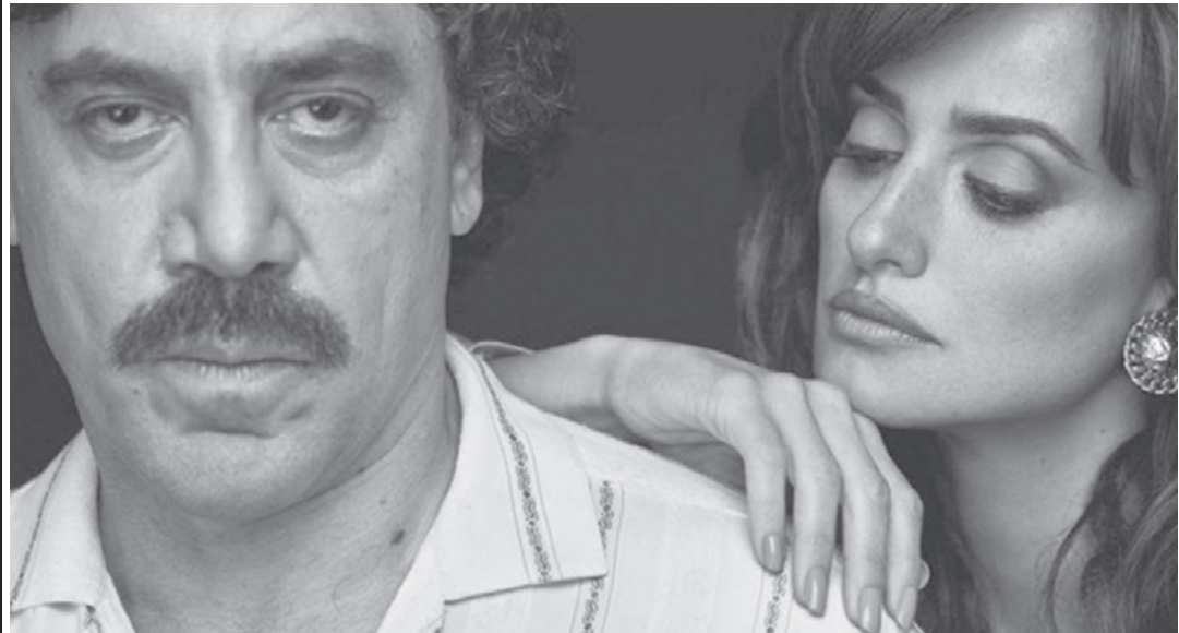
Кадр из фильма «Эскобар»

Композиция такова, что зритель не успевает понять: кто таков Эскобар — воплощённый ад или же великой души кому сапиенс? Какая глыба! Какой матерый человеечище! Вот он про-ринковенно вешает о проблемах колумбийской нищеты, но тут же — отдаёт чёткие приказания подельникам. Убивает как дышит. Для него нормально — сеять смерть. А через полчася — планировать построение Счастья. С той же невыра-