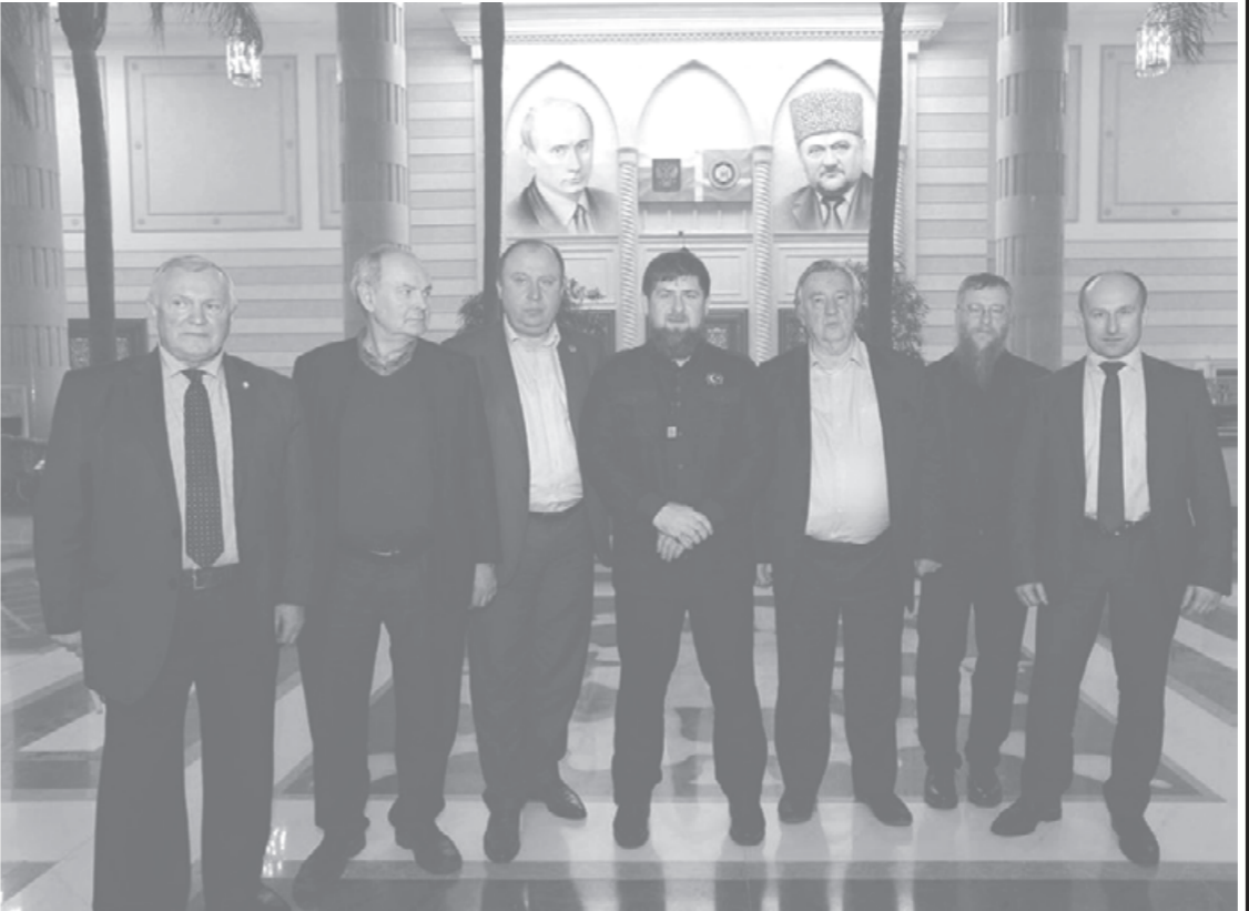
18 февраля 2016 года. Александр ПРОХАНОВ и Рамзан КАДЫРОВ (в центре) с членами Изборского клуба в музее Ахмат-хаджи КАДЫРОВА

А Звонарь из последних сил берётся в душе зерно веры. С этого зерна во время допросов и пыток пытаются содрать "оболочки", оскоряя Родину, боевых товарищей, веру. Но неотмирными очами русский воин прозревает икону, которая оказывается вратами Царствия Небесного. А после будет икона, написанная уже земным иконописцем. А после — будет акафист, где прозвучит до времени сокрытое Слово... Слово о том, что Россия