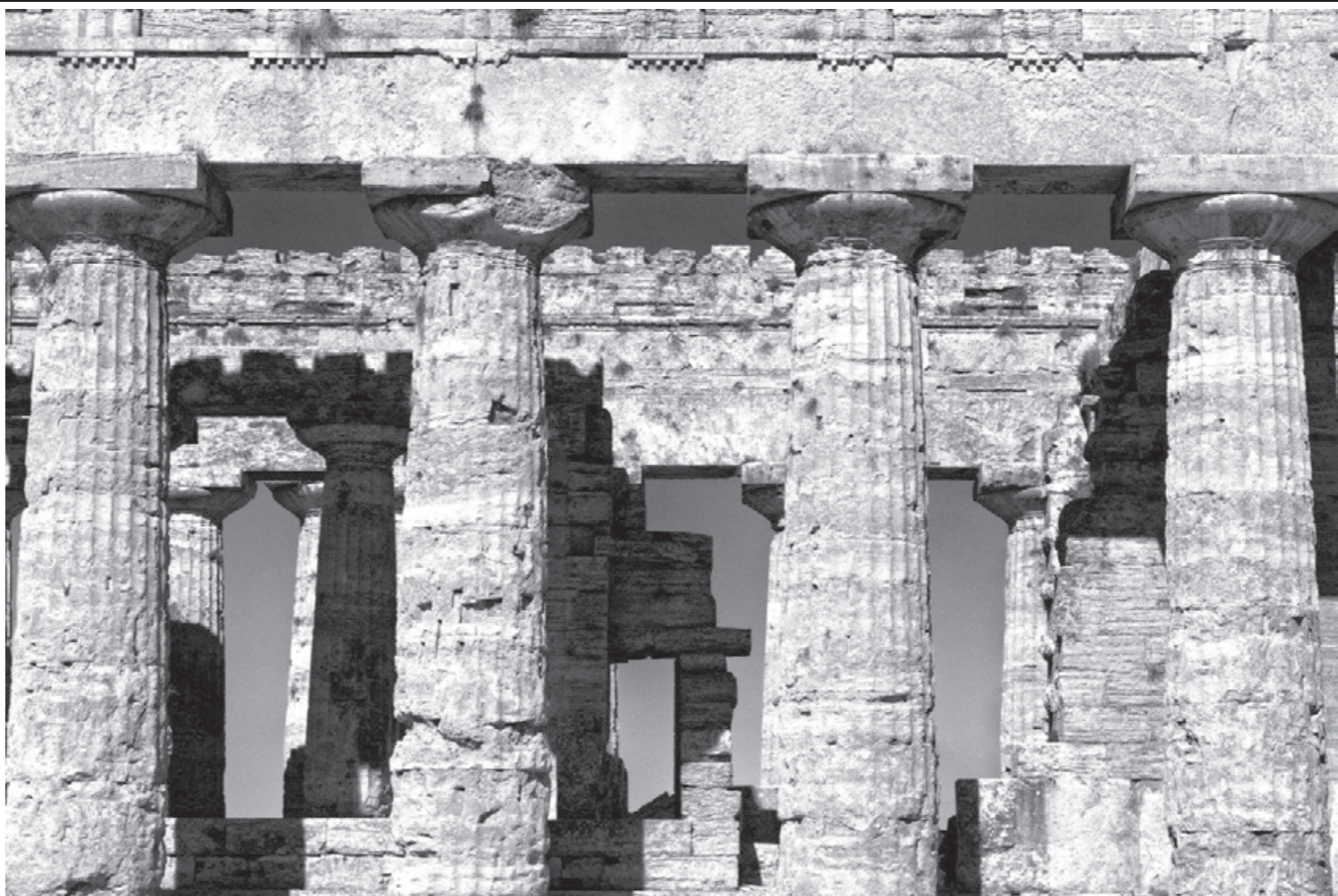
Фото из проекта «Порядок» (2017).