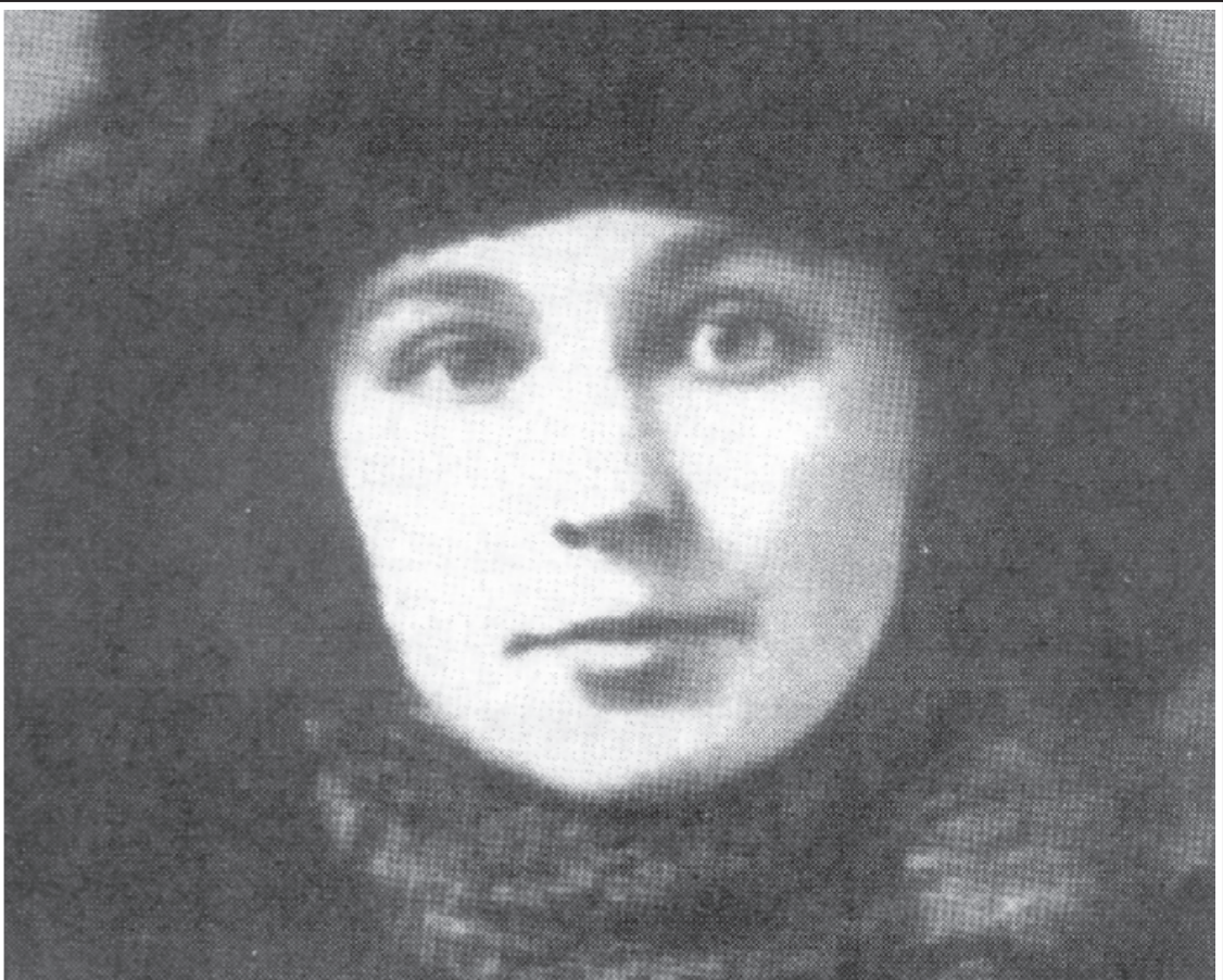
Марина ЦВЕТАЕВА. Фото 1917 года

В землю чёрную, питать тростник — Невозвратно, неостановимо, Неостановимо хлещет стих.