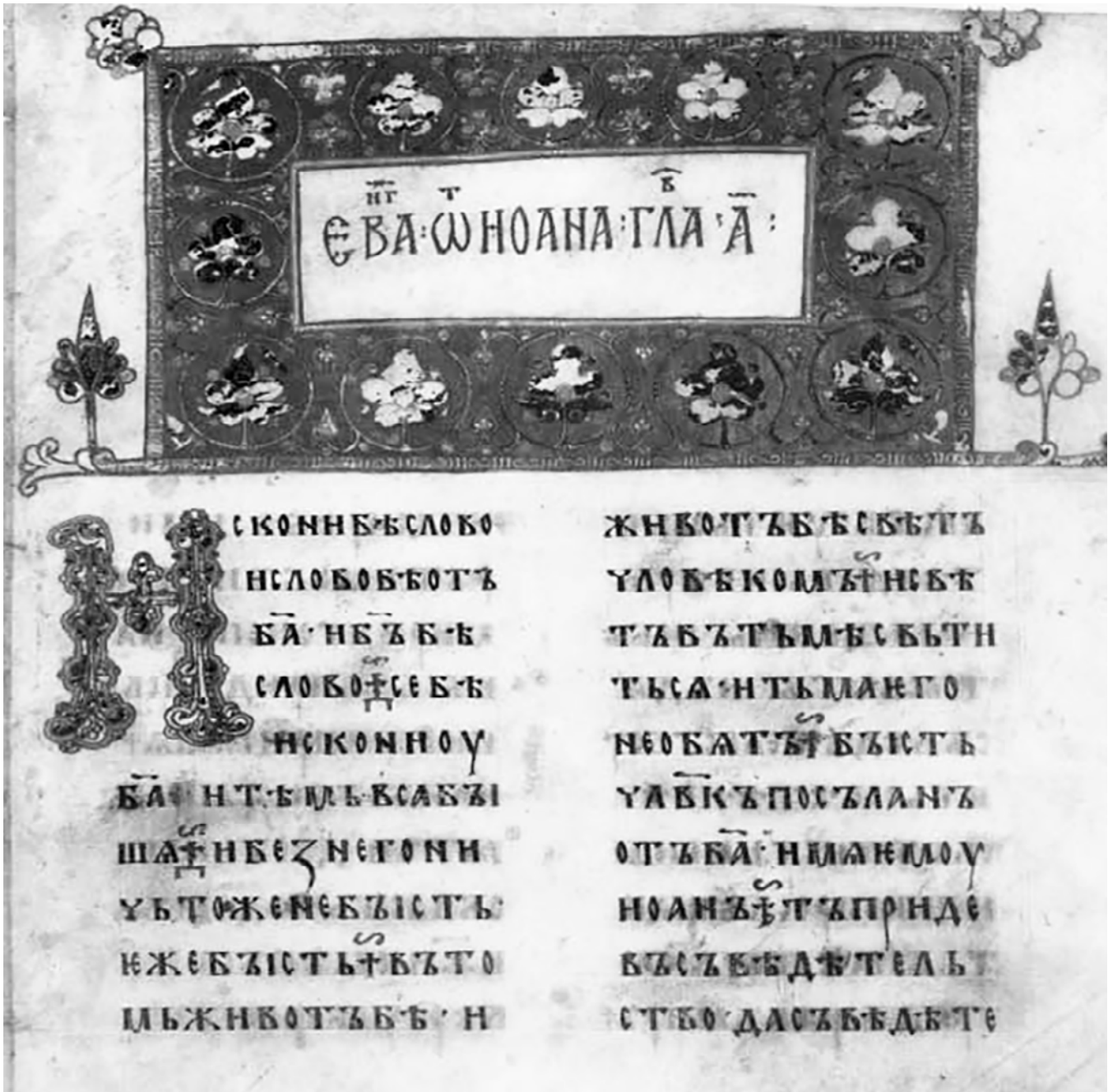
Остромирово Евангелие. Середина XI века

Умирающий Борис Пастернак позвал к себе лингвиста Вячеслава Иванова и стал рассказывать ему о своих прозрениях: "Мне видятся два мира: наш и потаённый. Между ними завеса, и что-то узнать о сокрытом мире мы можем лишь по колыханию завесы.