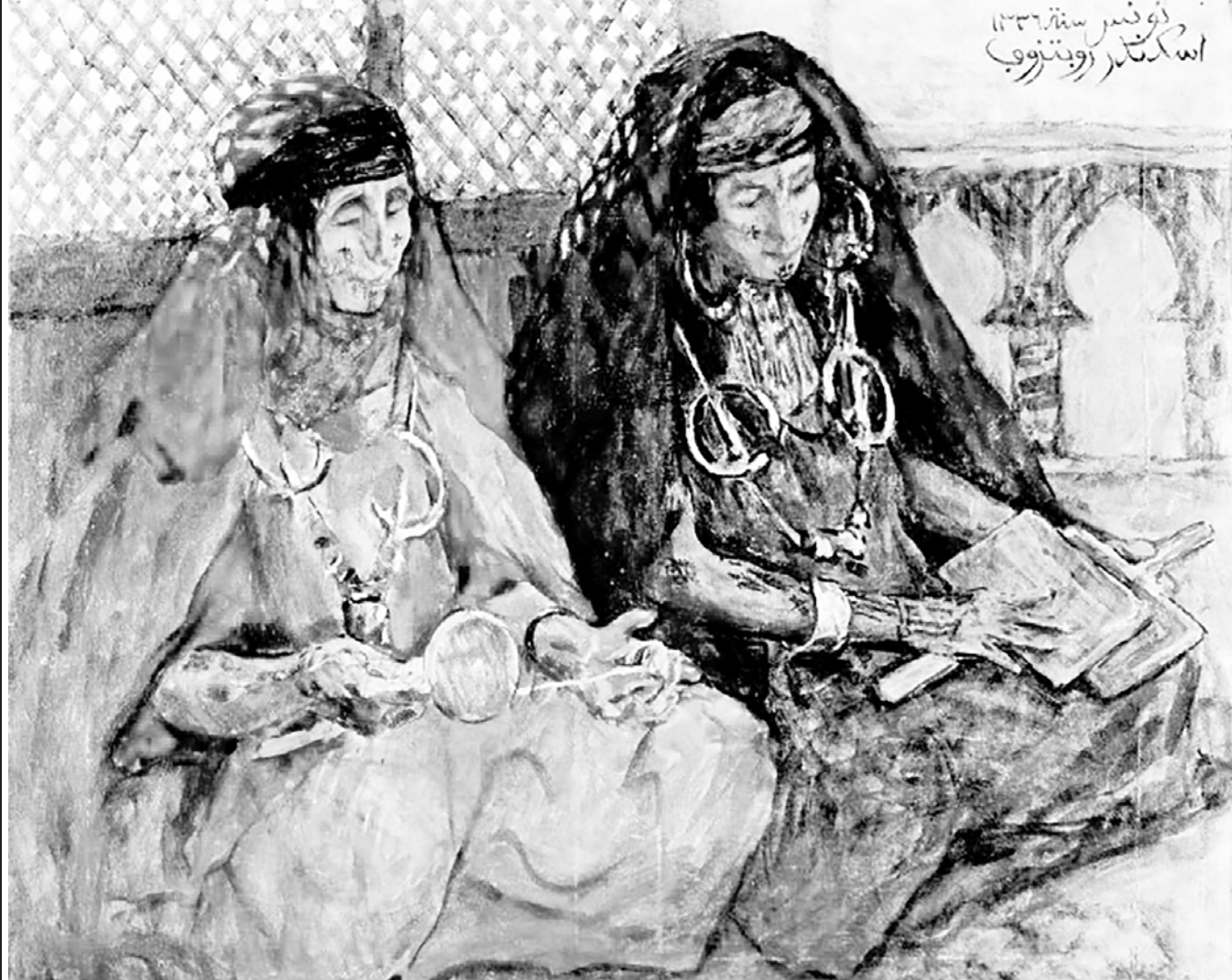
«Чесальщицы шерсти». Художник А.А. Рубцов. 1917 г.

О нём гораздо лучше знают в Тунисе и во Франции, чем в России, однако Третьяковка решила восполнить этот пробел, и в её стенах сейчас проходит выставка "Под солнцем Карфагена", посвящённая