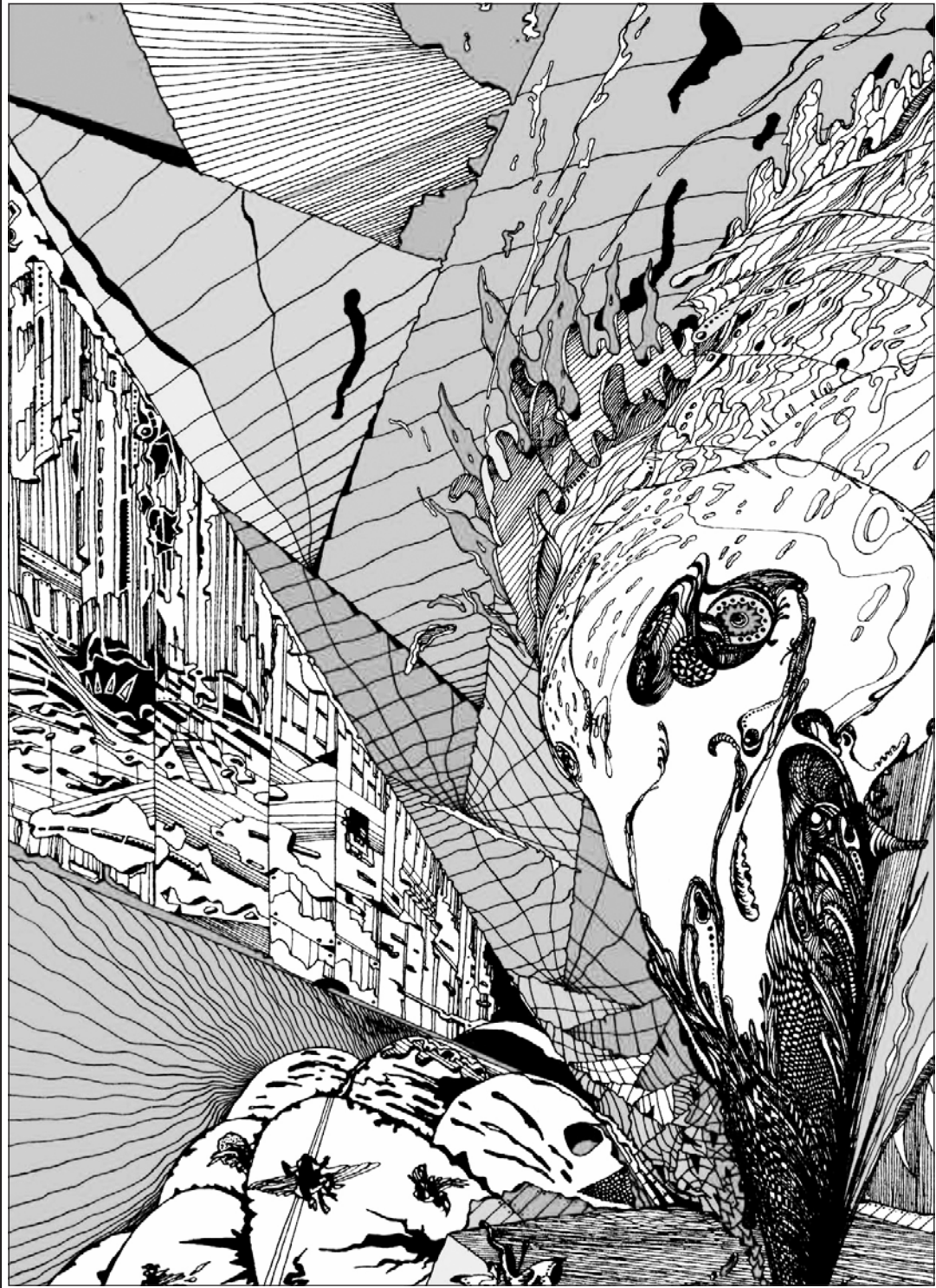
Окончание. Начало статьи — в №№ 43, 44

Без теории нам смерть, смерть, смерть. И.В. Сталин