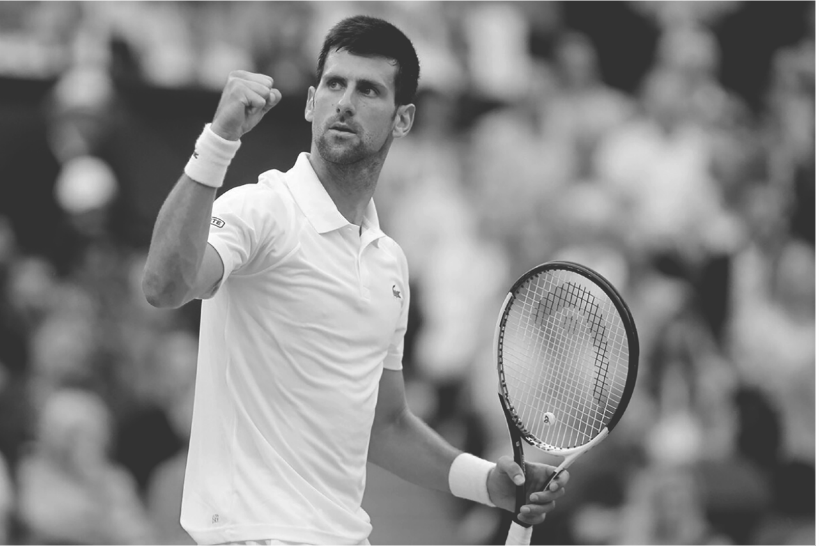
Первая ракетка мира сербский теннисист Новак Джокович

Пчёлко Александр, Поляк Григорий. Арифметика для 2 класса. 1957. — М. : Наше Завтра, 2022. — 128 с.