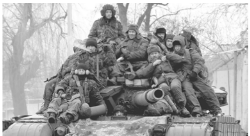
г. Рязань, Рязанская область

Отче наш, спаси Россию! Русь Святую береги! Милосердно отпусти ей Все великие грехи. Упадём мы на колени, Вскинем взор на образа — След жестоких поколений Сметет чистая слеза. Миром будем мы молиться От зари и до зари: — О, Небесная Царца, Благодарю озари! И святым своим покровом Всю Россию защити, Помоги нам путь суровый С верой в Господа пройти!