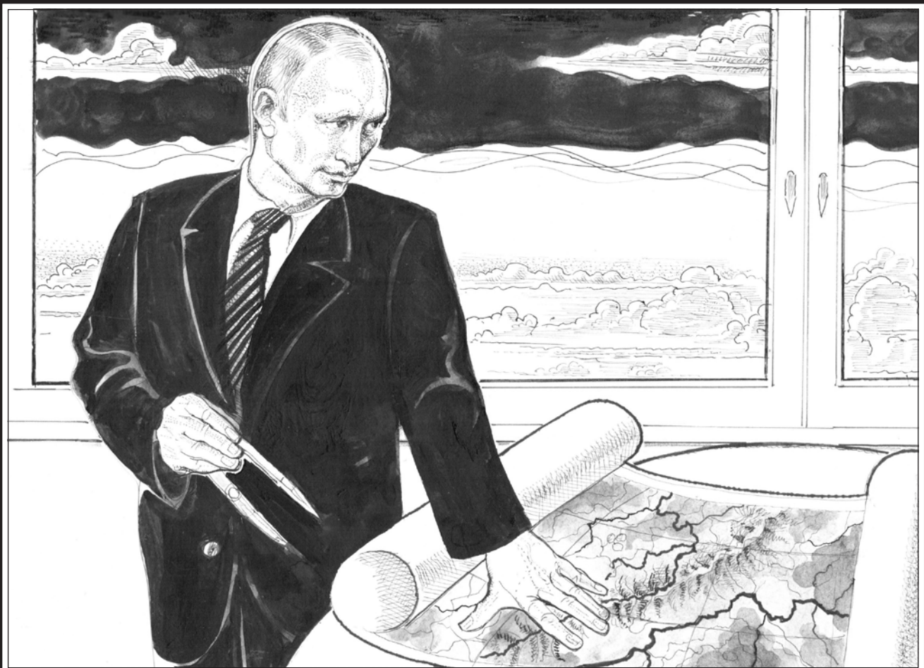
Рис. Геннадия ЖИВОТОВА

Между "Государством проектов" с его централизмом, плановостью и "полем свободы" существует противоречие и конфликтная среда, где воля централистского государства соприкасается с волей отдельного творца. Эта конфликтность может превратиться в катастрофическое противоречие, порождающее революции и гражданские войны. Поэтому между проектным государством и "полем свободы" должен существовать регулирующий нормирующий орган, умягчающий все противоречия, снижающий остроту конфликтов, исключаящий вопиющее социальное неравенство, останавливающий культуру осквернения и распада — плод извращённой психики пресыщенного индивидуума.