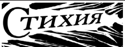
Иллюстрация: картина Васи Ложкина