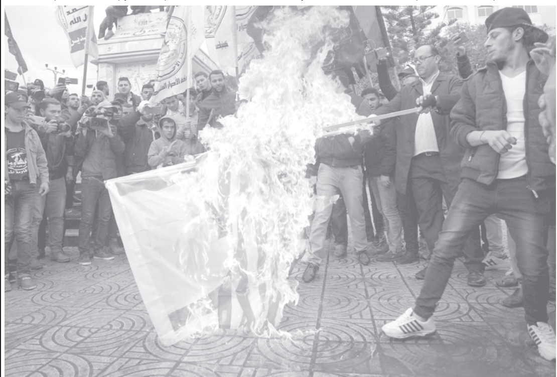
Декабрь 2017 года. Протестующие в Секторе Газа сжигают американский и израильский флаги

Не удивительно, что и в вопросе строительства новой водной артерии президент Турции пытается играть на противоречиях между Россией и США, ставя своей целью ослабление российских позиций в Чёрном море и изменение баланса в пользу Турции. В этом контексте Стамбульский канал представляет собой потенциальный рычаг давления на переговоры с Москвой и Вашингтоном. Он — тот самый перевал, через который можно пройти самые высокие горы международной политики. Но удастся ли Эрдогану реализовать этот масштабный проект и совершить очередной обходной манёвр, не утратив при этом доверия своих сограждан? Вопрос остаётся открытым.