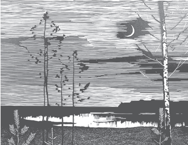
Северная ночь (1966). Художник Андрей УШИН.