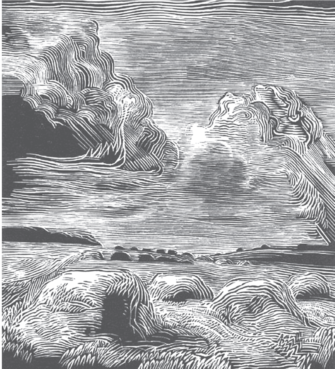
Лето в разгаре (1983). Художник Дмитрий ЦУП.