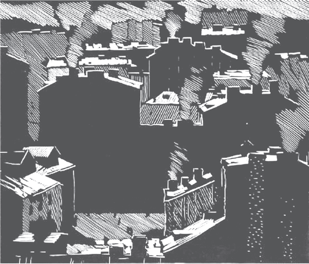
Зимний день (1964). Художник Андрей УШИН.