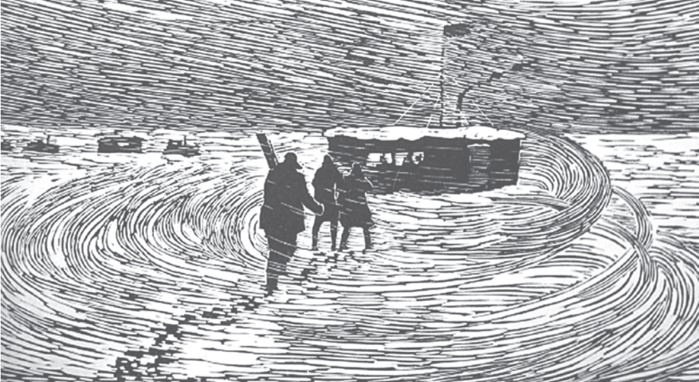
Первый день стройки (1967). Художник Павел ЯКУШЕВ.