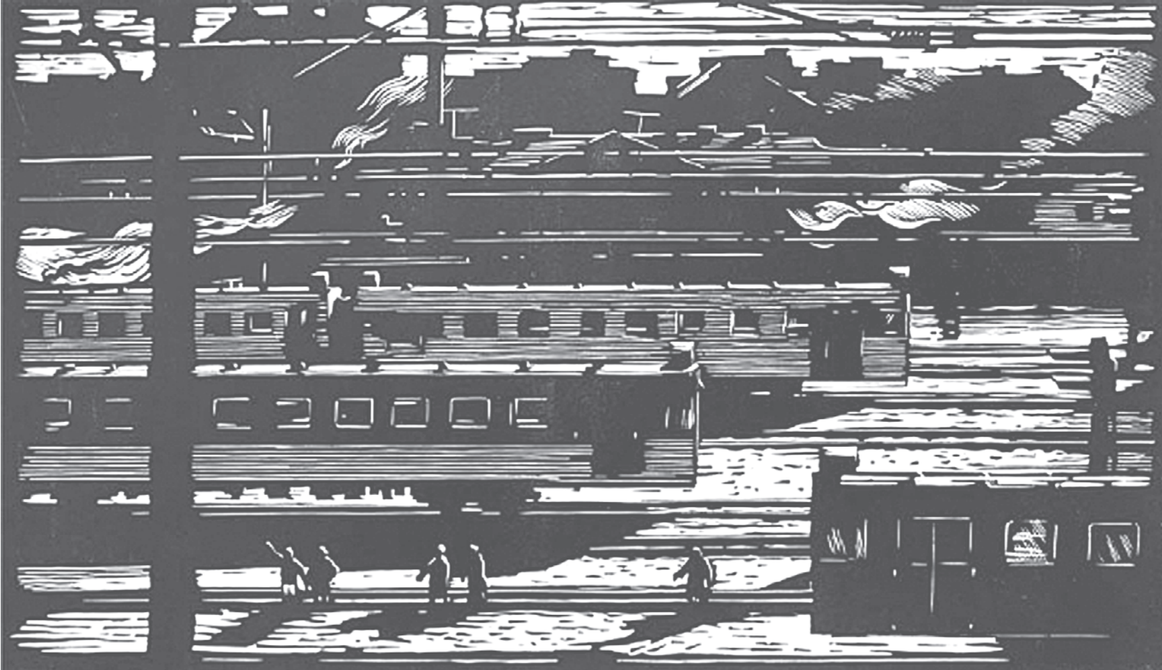
Пути (1960). Художник Андрей УШИН.