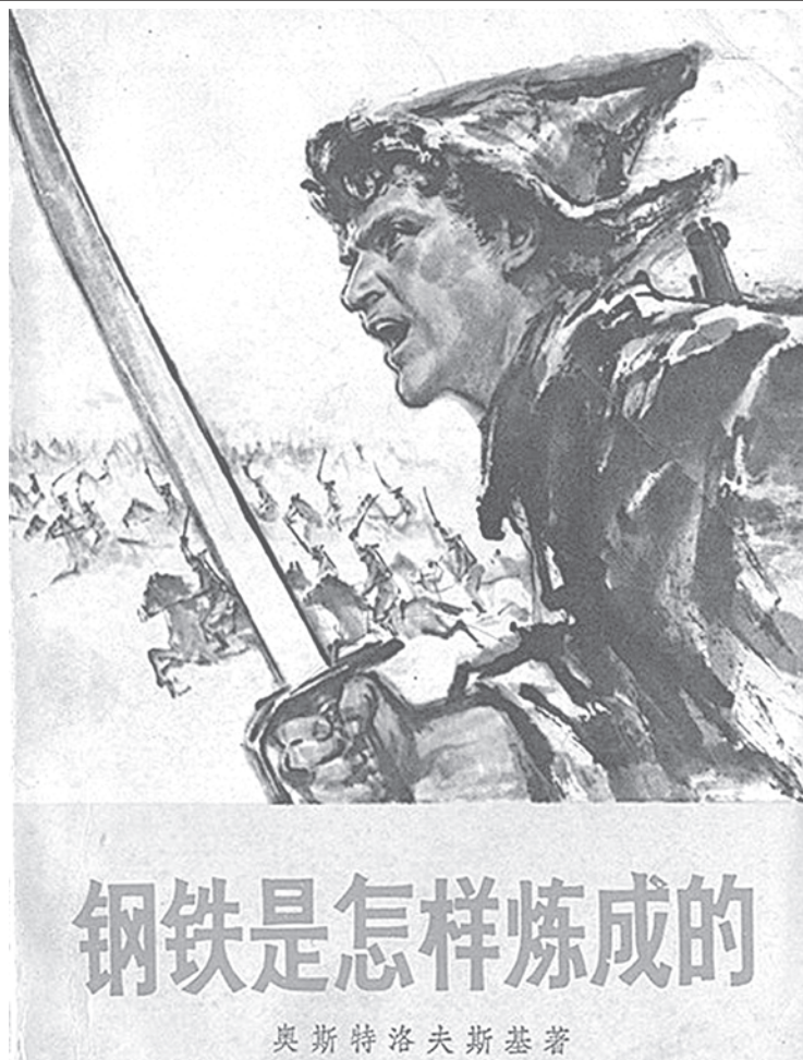
Обложка одного из китайских изданий романа Николая Островского «Как закалялась сталь»

Над Китаем перестали звонить колокола. Но на смену проповеди Евангелия пришёл образ Корчагина: всё та же великая идея победы над Смертью — гибели ради людей, мученичества и возрождения для вечной Жизни. "Как закалялась сталь" оказался новым посланием Русского мира