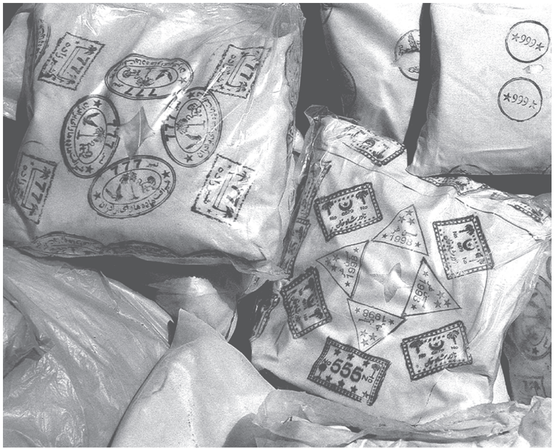
В 2018 году почти треть мирового трафика героина прошла через Россию

Оставляем для юристов и социальных экспертов тему, почему после развала СССР запрещённые к обороту вещества появились внезапно и по-