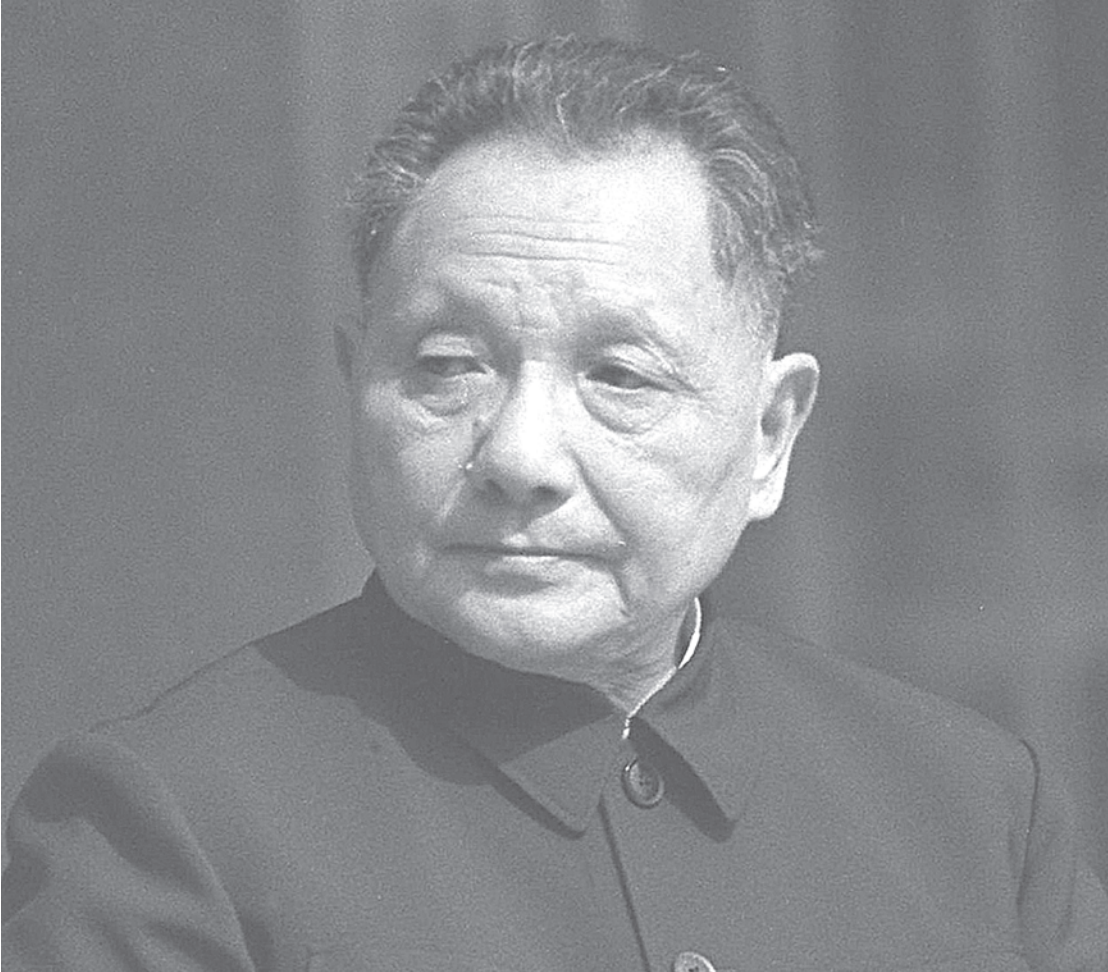
ДЭН Сяопин — «отец» китайской экономической реформы. Фото 1990-х годов

Решая ключевой вопрос выбора оптимальной эконо- мической модели, Си Цзиньпин для начала поста-