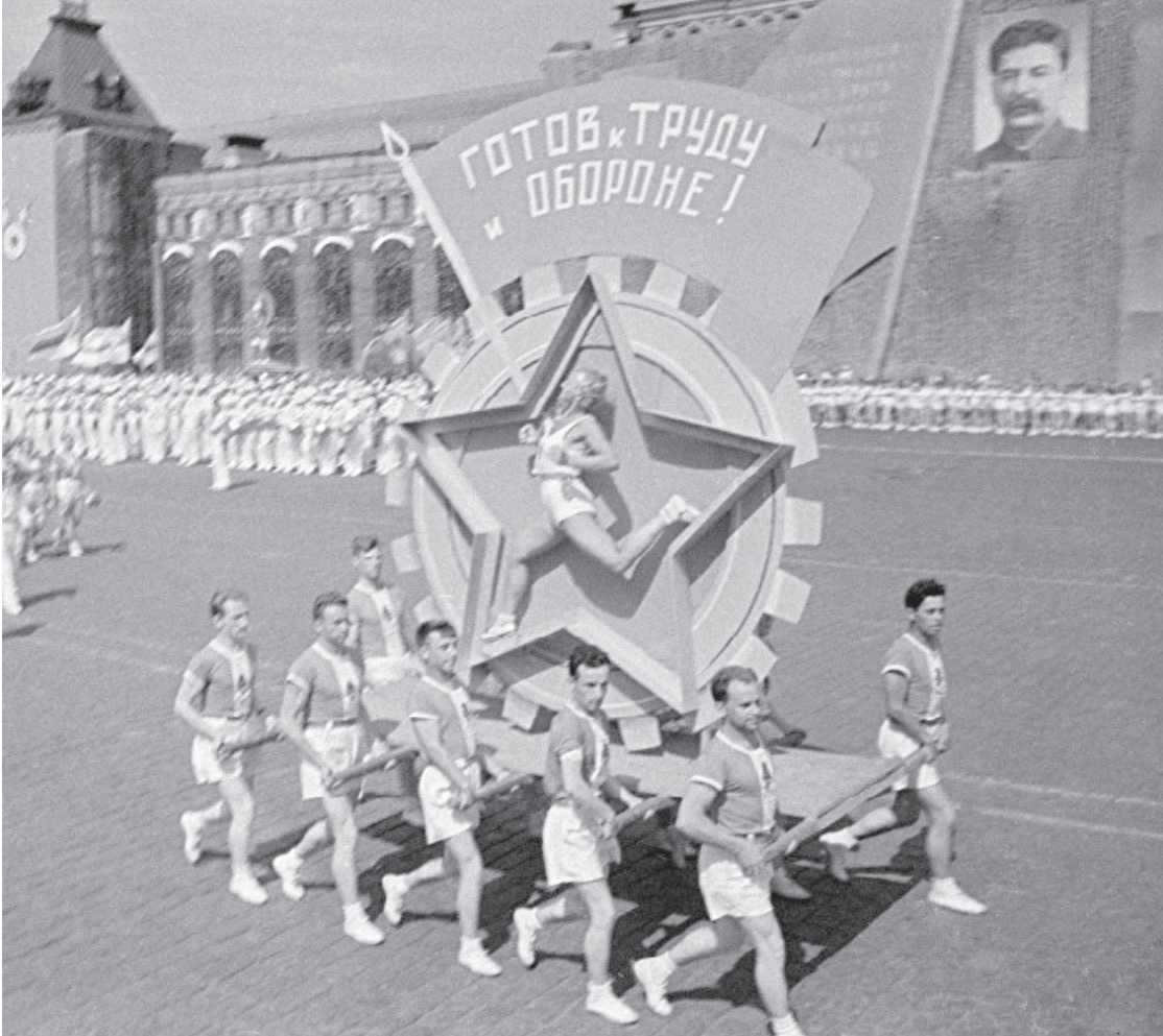
1939 год. Москва. Физкультурный парад на Красной площади.

Но снова с тевтонского края Свинцовые ливни поили. И падали мы, прикрывая Открытое тело Земли. А в наших серёчках моторах Звенели победы Петра, И Невский, Донской и Суворов С лекотой кричали: "Ура!" Нам легче всею в рукопашной Добраться до горла войны.